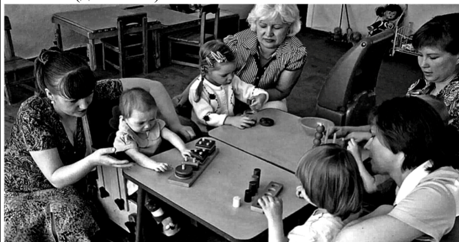
По информации пресс-службы Администрации Томской области

Проект призван сделать реабилитацию максимально доступной и быстрой. Подробности - по номеру 8 (38 22) 713-950 (доб. 2958). ■