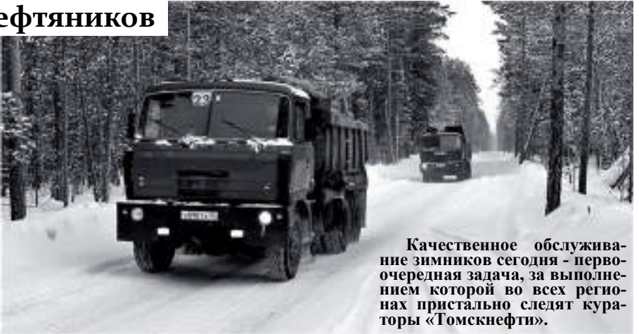
Качественное обслуживание зимников сегодня - первоочередная задача, за выполнением которой во всех регионах пристально следят кураторы «Томскнефти».

«Белые дороги» на месторождениях Лугинецкого региона - их протяжённость более 420 километров - уже более десяти лет строит один и тот же подрядчик. Все маршруты, особенно-